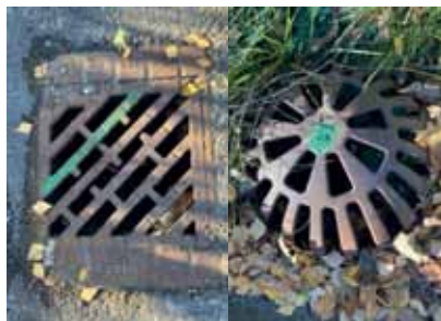
Rännstensbrunn i gatan

Snart är det vinter och då kan det vara bra att veta var din närmaste dagvattenbrunn i gatan eller vid sidan om finns. Förra vintern fick vi känna av att det töade och frös om vart annat och vi hade stora vattensamlingar på våra vägar på grund av bristfällig snöröjning. Blir det likadant i år kan man själv behöva frilägga sin dagvattenbrunn från is och snö för att få vattnet att rinna undan. Det finns två typer av dagvattenbrunnar: ■