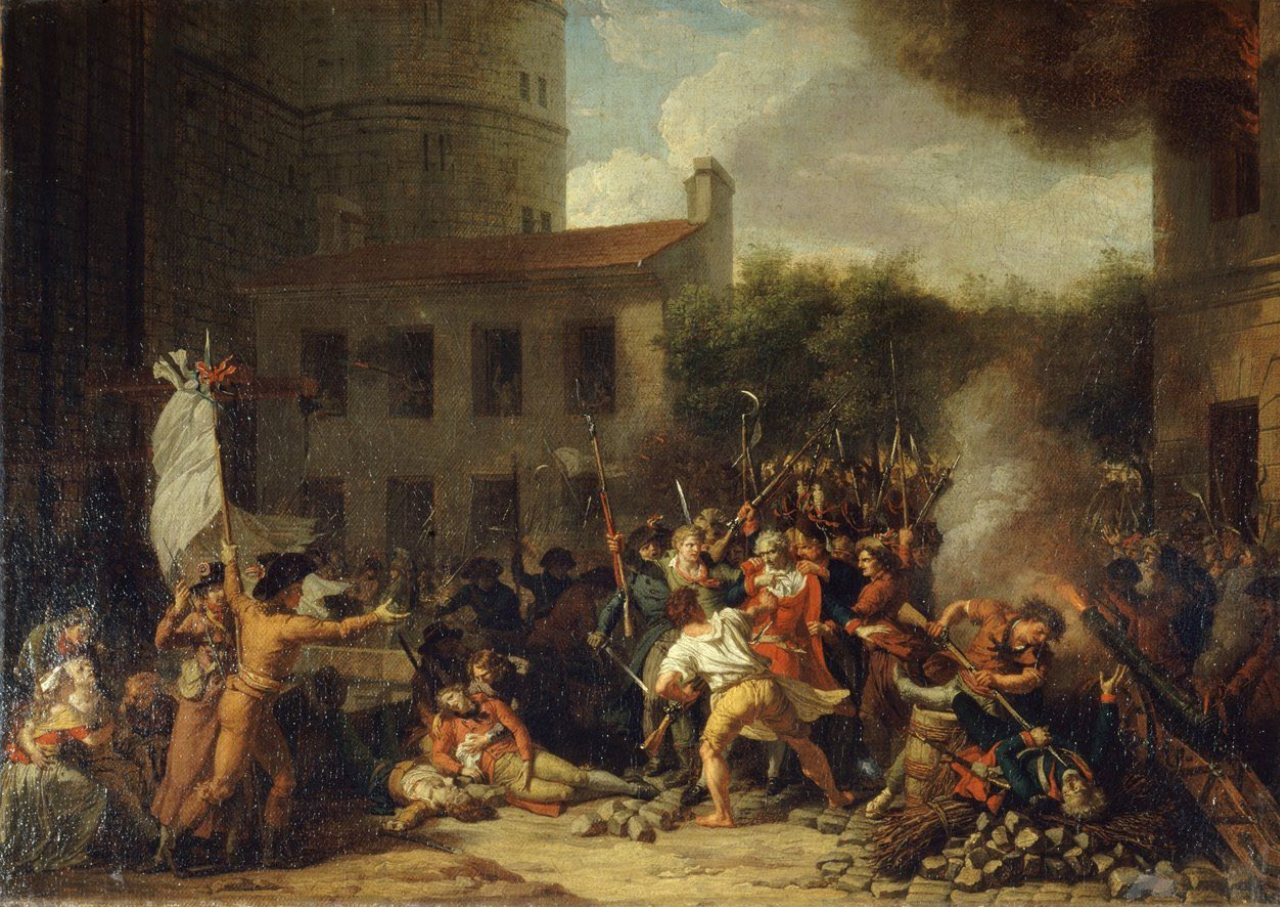
Stormningen av Bastiljen 14 juli 1789 av Charles_Thevenin